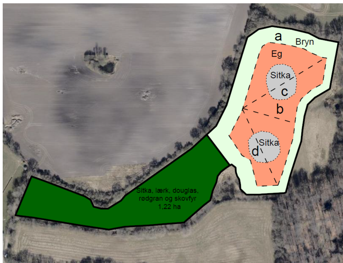
Skovkort, forventet arts sammensætning